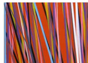
José Piñar, 2012 Acrílico sobre tabla 25 x 35 cm c/u

Apuntando un fragmento del texto de David Barro para la exposición en el CAAC de Sevilla: Todavía no hemos terminado. A propósito de José Piñar.